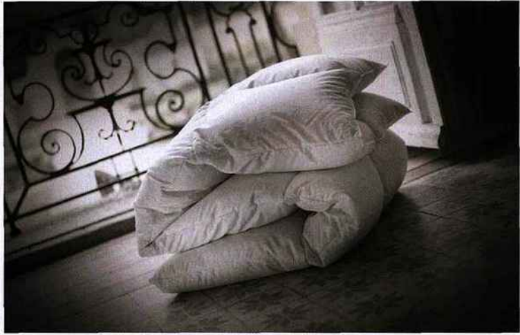
Couette duvet Eider Ce premier Millésime de l'enseigne assure une chaleur instantanée et régulée tout au long de l'année grâce à sa composition intégrant duvet de canard d'Eider.

C'est en 1880, à Paris, que la famille Dumas, originaire d'Auvergne débute son acti-