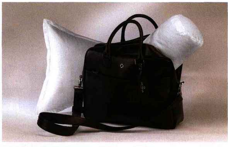
Nouvelle collection Vendu dans un sac de cuir marron italien élégant, cet « oreiller de voyage » en 70 % duvet, 30 % plumettes de canard neuf européen associe un cale-nuque du même type de garnissage.